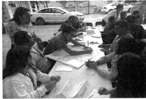
Jornada de capacitación en oficinas centrales (Edificio El Porvenir).