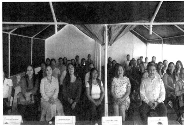
Jornada de capacitación en oficinas alternas (Edificio Los Pinos).

Lo que se informa a las y los integrantes de este Comité de Ética, para los efectos conducentes.